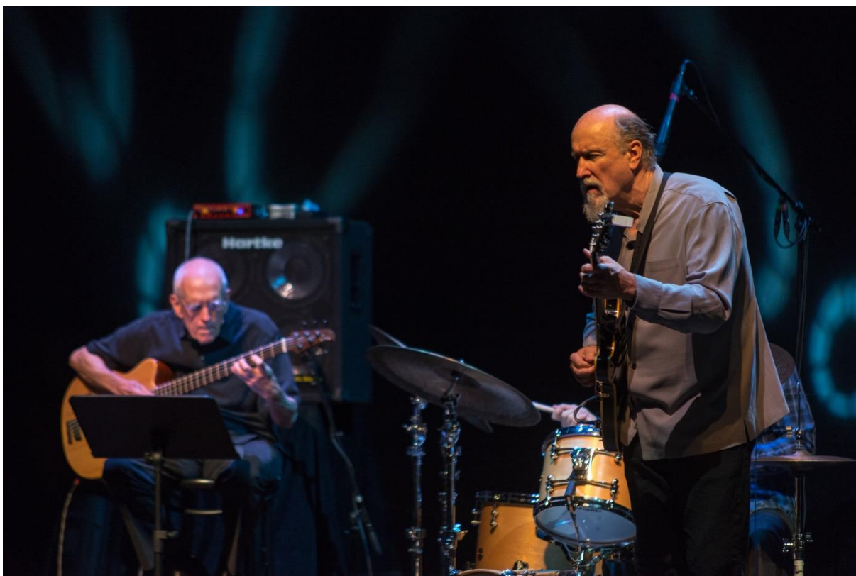
2. 11. 2016, Sono Centrum

JAZZFESTBRNO, o.p.s. IČ: 270 28 194 Sídlo: Kolářkova 21, 621 00 Brno Kancelář: Veveří 38, 602 00 Brno