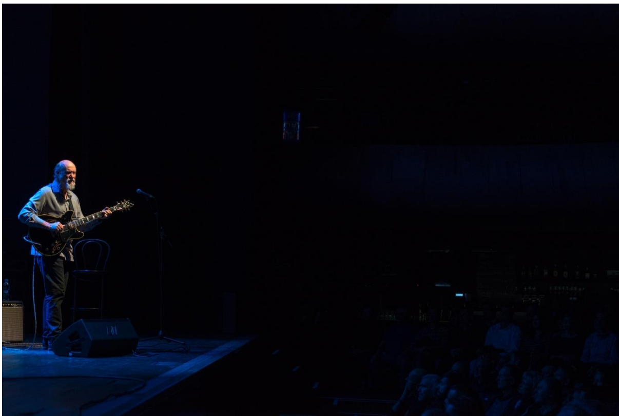
2. 11. 2016, Sono Centrum