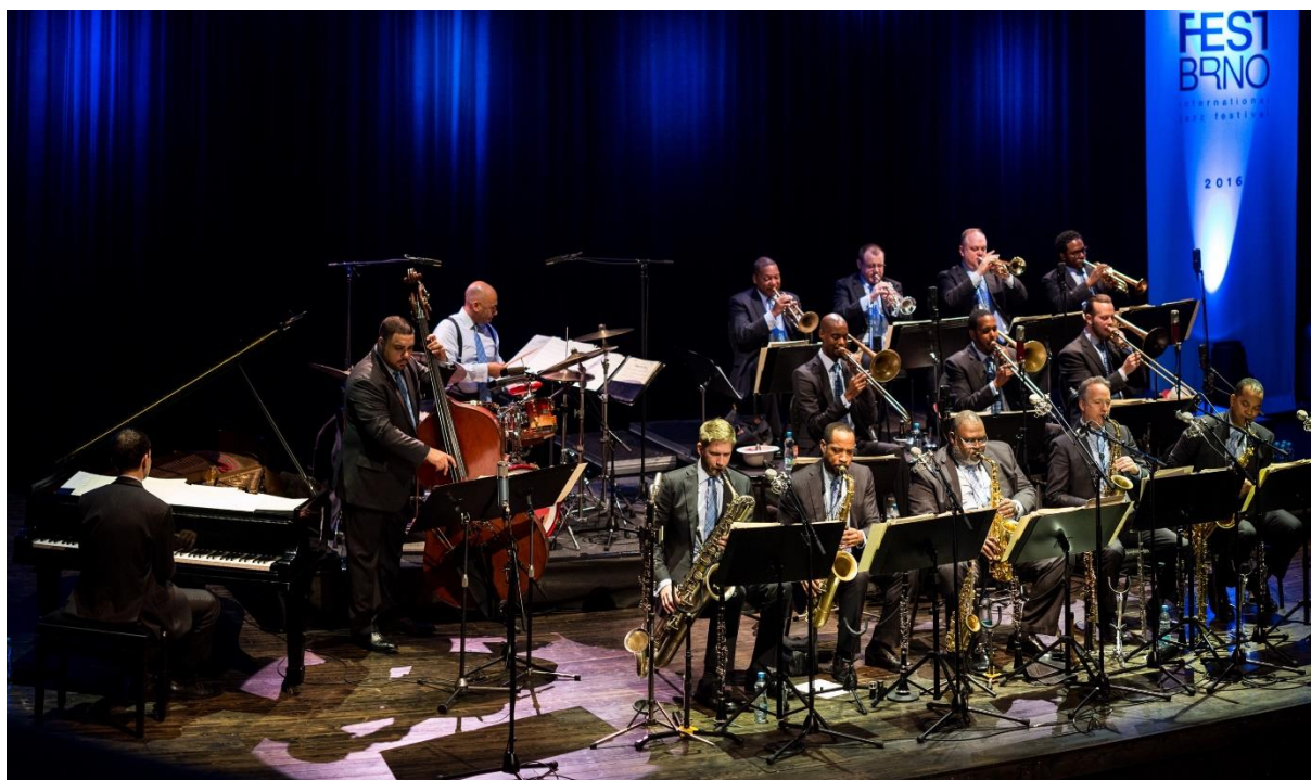
12. 2. 2016, Sono Centrum Jazz at Lincoln Center Orchestra with Wynton Marsalis

Dlouhodobou ambicí organizátorů festivalu je především rozprout hudbu do měst a okořenit je přítomností světových jmen. To se s přispěním veřejného sektoru, velkorysých firem a především návštěvníků lačných kvalitní hudby bohudík už patnáct let daří. Společně s našimi příznivci se proto těšíme na šestnáctý ročník na jaře příštího roku.