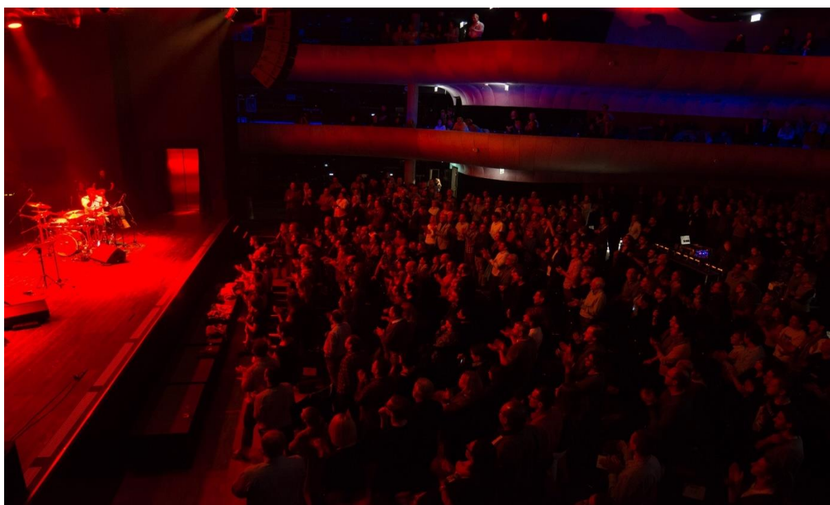
8. 11. 2016, Sono Centrum

JAZZFESTBRNO, o.p.s. IČ: 270 28 194 Sídlo: Kolářkova 21, 621 00 Brno Kancelář: Veveří 38, 602 00 Brno