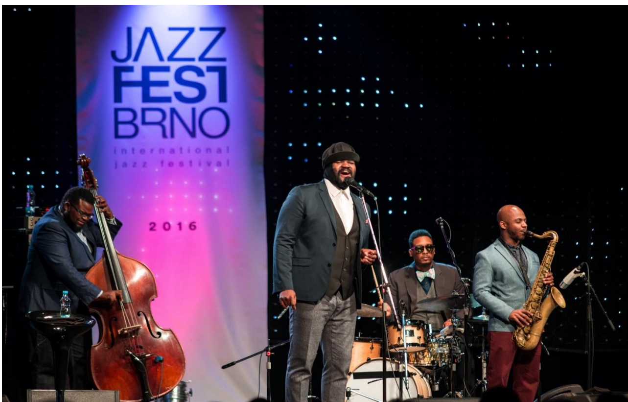
8. 3. 2016, Bobycentrum Gregory Porter

JAZZFESTBRNO, o.p.s. IČ: 270 28 194 Sídlo: Kolářkova 21, 621 00 Brno Kancelář: Veveří 38, 602 00 Brno