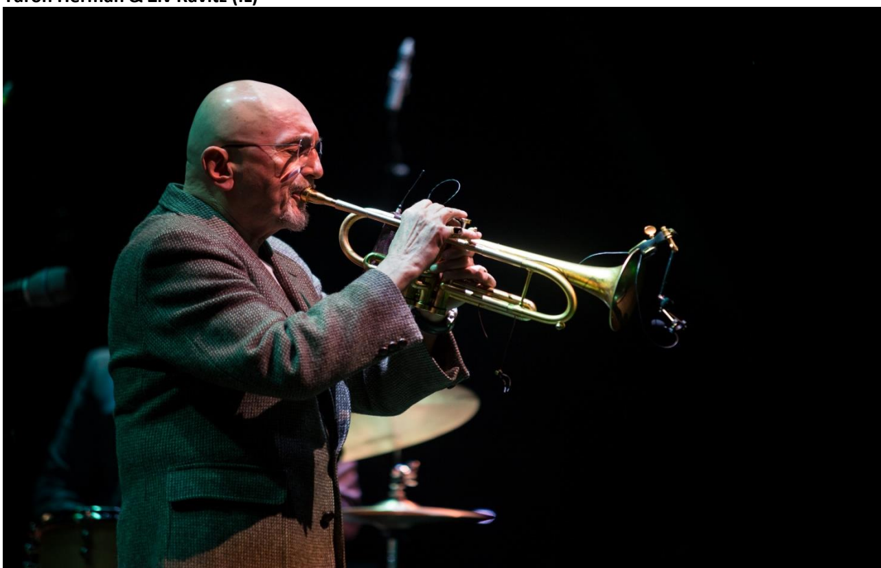
17. 4. 2016, Sono Centrum Tomasz Stańko Quartet (PL, US, CU)