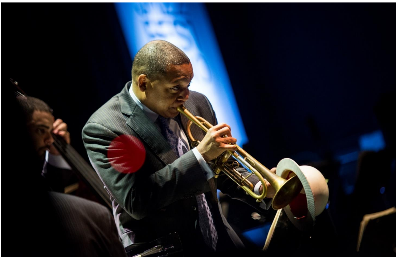
12. 2. 2016, Sono Centrum Jazz at Lincoln Center Orchestra with Wynton Marsalis (US)