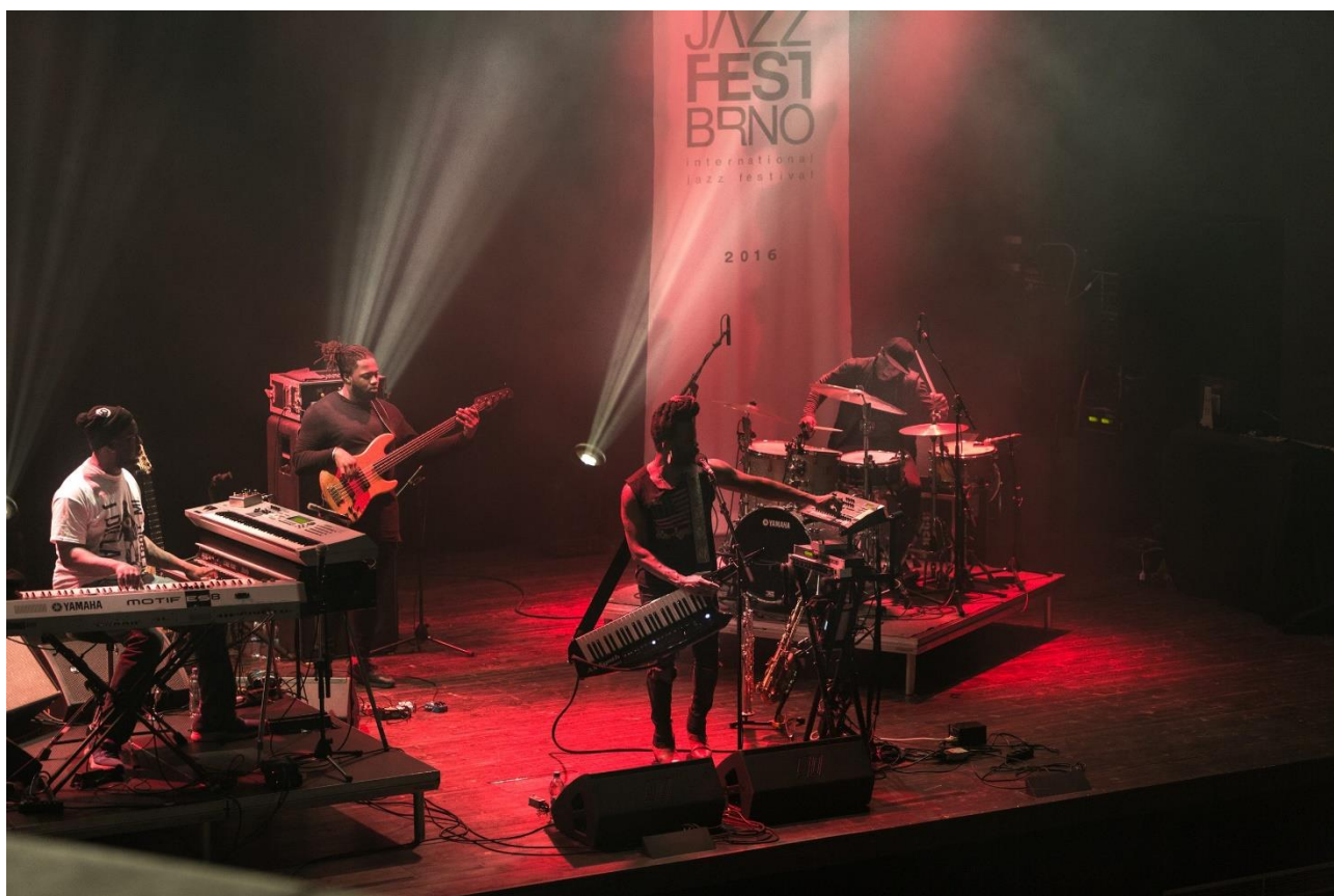
11. 4. 2016, Sono Centrum Robert Glasper Experiment (US)