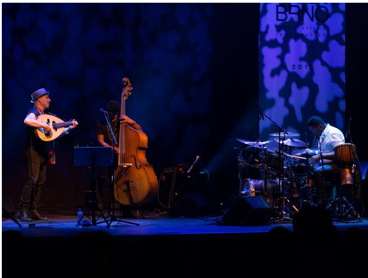
8. 11. 2016, Sono Centrum