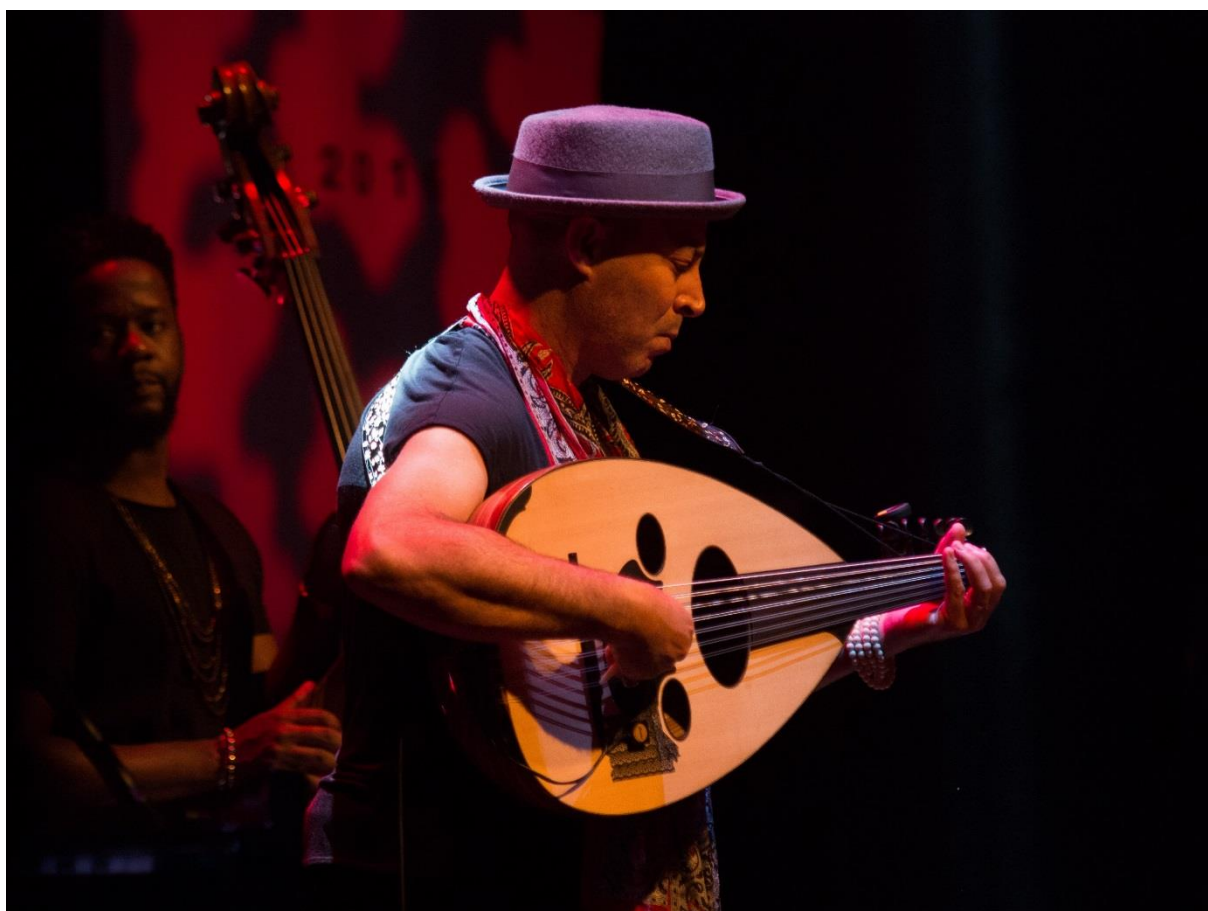
8. 11. 2016, Sono Centrum